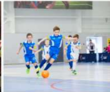
Программа по мини-футболу