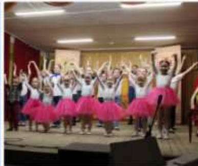
ДОП "Современный и балетный танец"